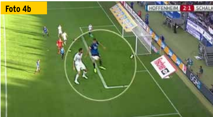
...oder hat der Hoffenheimer sich Richtung Ball „gelehnt“, um die Flanke regelwidrig abzufangen?