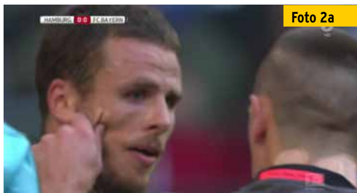
Im Vorbeigehen kniff Franck Ribéry dem Hamburger Nicolai Müller in die Wange.

Nach einem Schalcker Eckstoß durch Max Meyer spielt Kerem Demirbay den Ball im eigenen Strafraum eindeutig mit dem Arm - aber auch absichtlich? Die Analyse der TV-Bilder lässt da durchaus unterschiedliche Sichtweisen zu. Demirbay hält den Arm nah am Körper und versucht offensichtlich auch, ihn im letzten Moment wegzuziehen ( Foto 4a ).