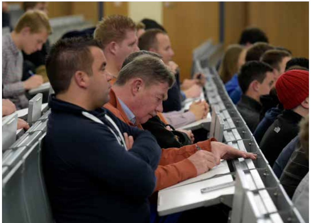
Im bunt gemischten Plenum saßen Schiedsrichter, Funktionäre, Juristen und Fußball-Interessierte.