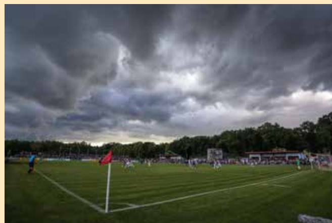
Zieht ein Gewitter auf, dann muss der Schiedsrichter diese Gefahr ernst nehmen.

Aber: Der Unparteiische hat in diesem Beispiel auch alles falsch gemacht, was er falsch machen konnte. Jan F. Orth: „Für eine strafrechtliche Haftung muss es schon wirklich ‚dicke kommen‘ und der amtierende Schiedsrichter ganz elementare Pflichten vernachlässigen.“