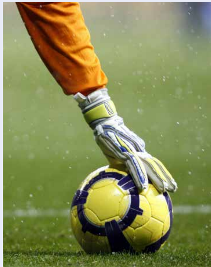
Hat der Torwart eine Hand am Ball, darf dieser nicht mehr vom Stürmer gespielt werden (Situation 13).

Nein. Der Team-Offizielle darf sich jederzeit aus dem Innenraum entfernen. Lediglich während des Aufenthalts im Innenraum ist das Geben von Anweisungen unter Beachtung verschiedener