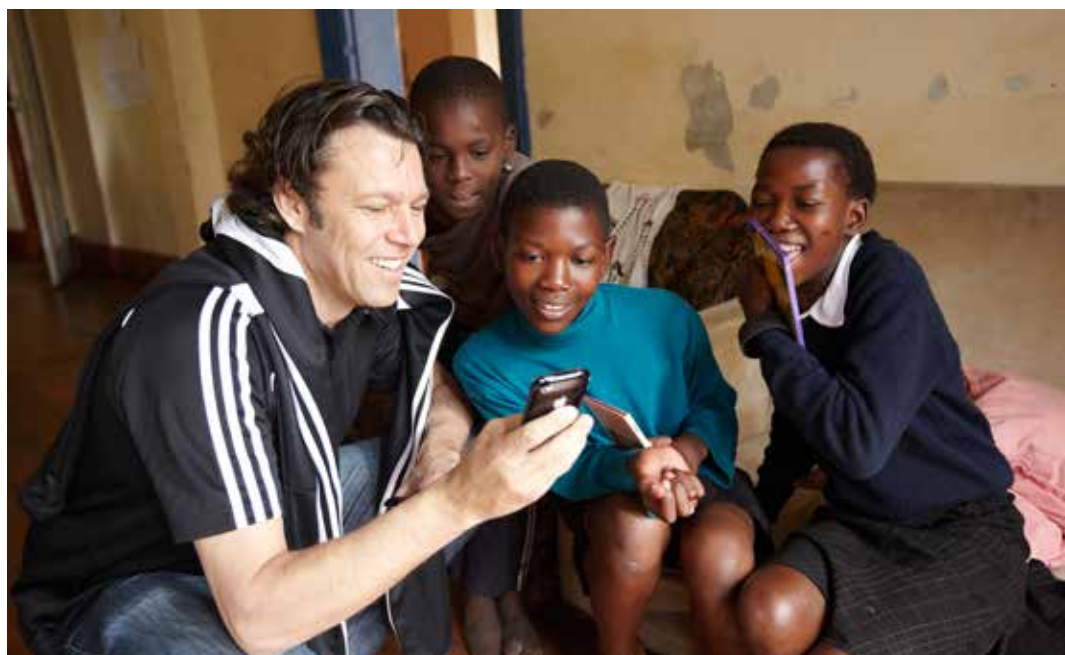
Der ehemalige FIFA-Schiedsrichter Urs Meier wurde für sein Engagement als Botschafter für die Kindernothilfe ausgezeichnet.