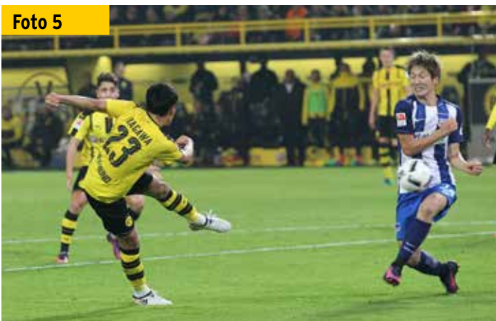
Kurze Entfernung, Oberarme angelegt, aber der Unterarm ist abgewinkelt: normale Fußballer-Haltung oder absichtliches Handspiel?