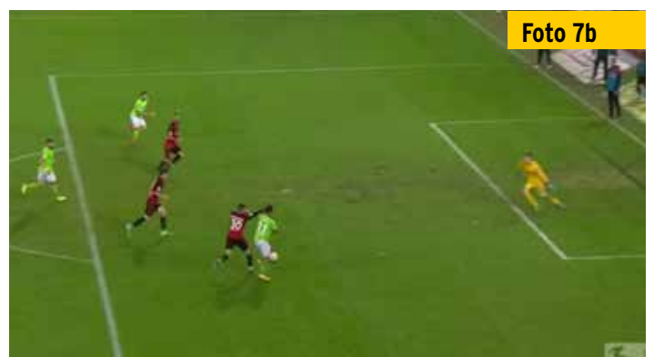
...er aber nur durch einen Griff an die Schulter seines Gegenspielers vereiteln kann.