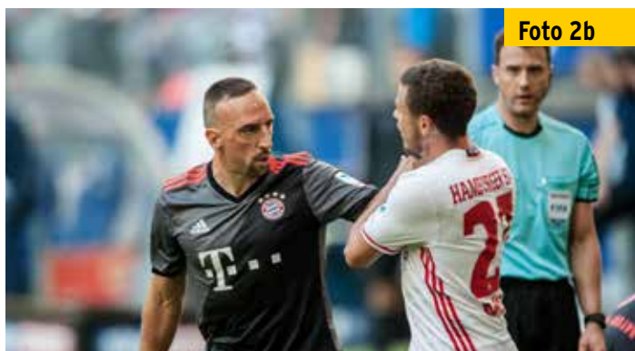
Schiedsrichter Felix Zwayer kann aus seiner Position die Situation sehr gut bewerten.