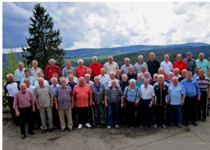
Während des Lehrgangs in Saig stellten sich die Schiedsrichter-Senioren den Fotografen.