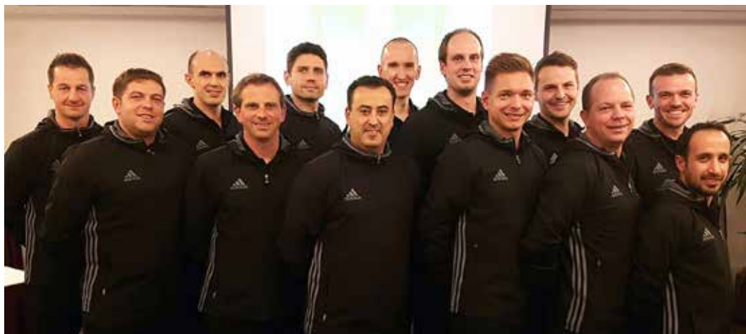
Die DFB-Futsal-Schiedsrichter bei ihrem jährlichen Lehrgang in Hamburg.

Der Verband hat seinen Zuschuss von zwölf auf 14 Millionen Euro erhöht und hofft, so die Leistung der französischen Unparteiischen, die international zuletzt kaum eine Rolle gespielt haben, durch die erhöhten Zuwendungen zu verbessern. Demnächst soll es zudem 18 statt bisher elf Elite-Schiedsrichter geben.